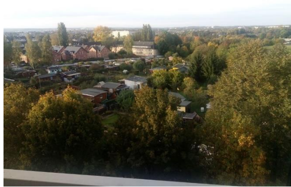
Blick vom Balkon (3)