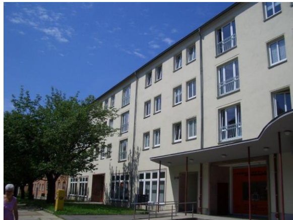
entlang der Lutherstr.