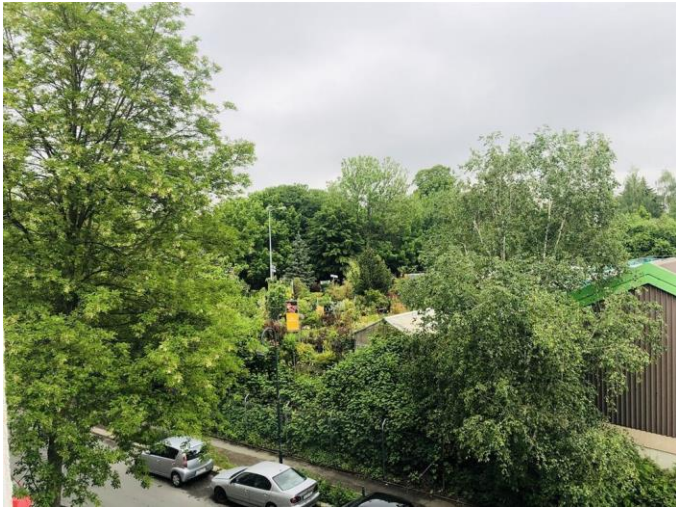
Blick v. Wohnzimmer