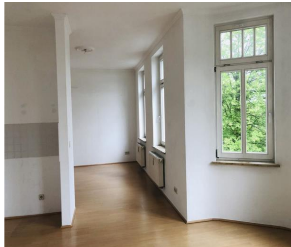
Blick zum Schlafbereich