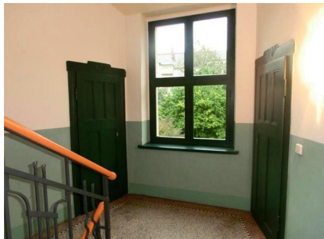
Treppenhaus mit Abstellkammer