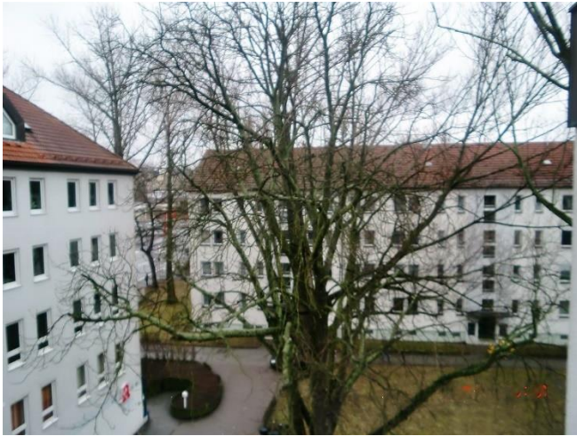
Blick in den Innenhof