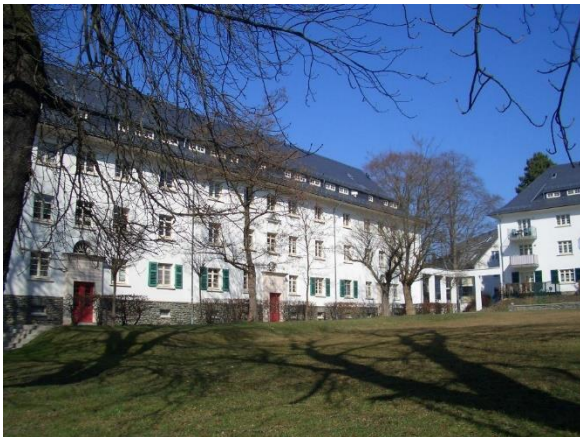
Ansicht mit Grünfläc