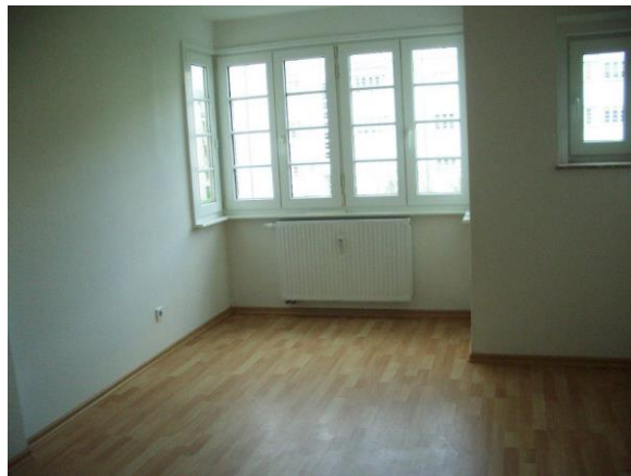
Bsp. Schlafraum (2)