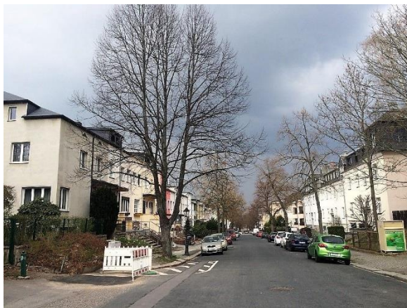
entlang der Straße