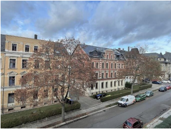
Blick v. Wohnzimmer