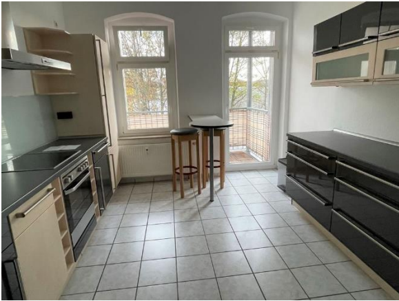
Küche mit BLK