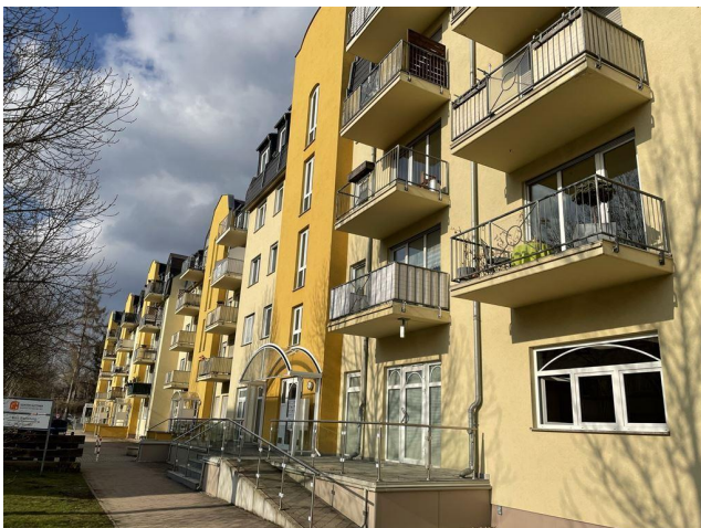
Schulstraße 25 h