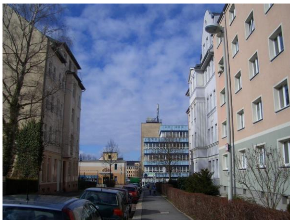
entlang der Straße