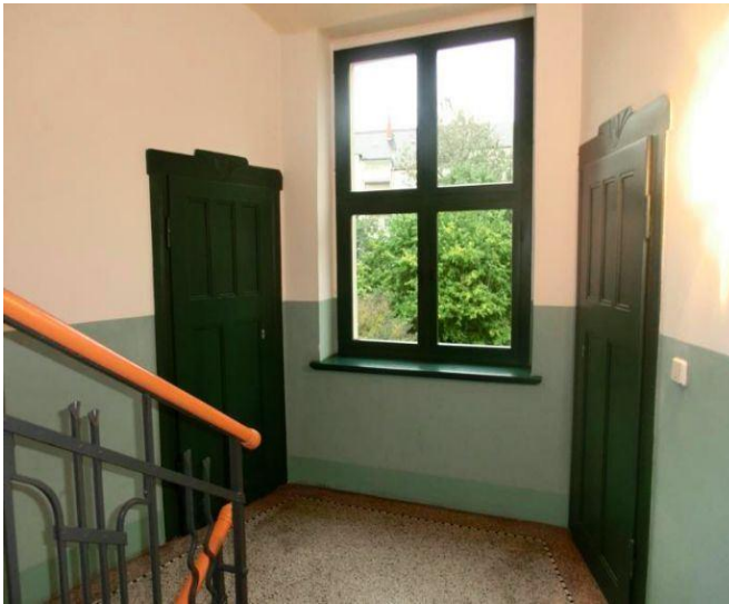
Treppenhaus mit Abstellkammer