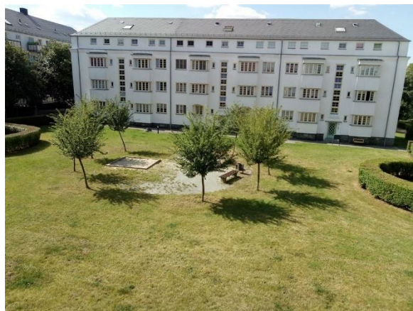
Blick aus dem Fenster