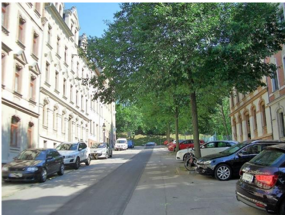
entlang der Straße