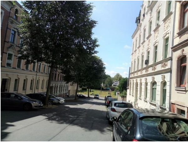
entlang der Straße