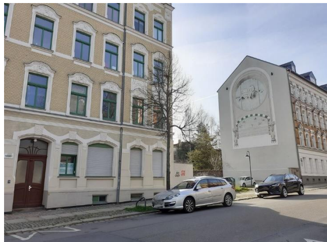
entlang der Straße