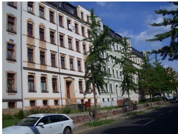
entlang der Straße