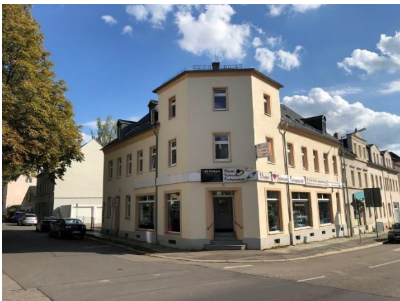
Frankenberger Str. 70