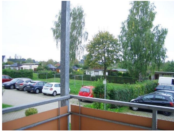
Blick vom Balkon (2)